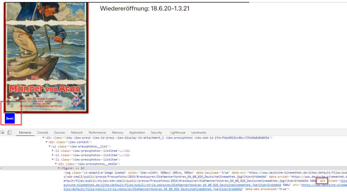
Abbildung 3 Presse