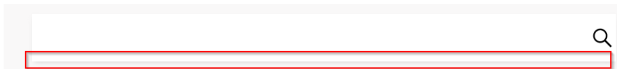
Abbildung 5 Suche

Suche: Der Kontrast des Borders des Suchfeldes ist nicht ausreichend. Das Kontrastverhältnis sollte mindestens 3:1 haben. Der Border hat einen Kontrast zum Hintergrund von 1,3:1. (Abb.05)